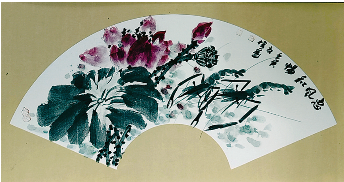
惠风和畅 宋冬冬 绘