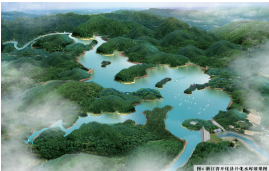
图4 浙江省开化县开化水库效果图

开化水库工程地处钱塘江源头、衢江流域常山港干流马金溪上游,坝址位于开化县马金镇石柱村上游约500米处,距离开化县城区25公里,坝址以上集水面积233平方公里。水库工程供水对象是中心城区(包含芹阳办事处和华埠镇)、马金镇、音坑乡、村头镇、池淮镇、桐村镇等区域。输水工程设计流量2.89立方米/秒,多年平均发电量0.2687亿千瓦时。项目总投资45.54亿元,建设工期为2021年-2024年。