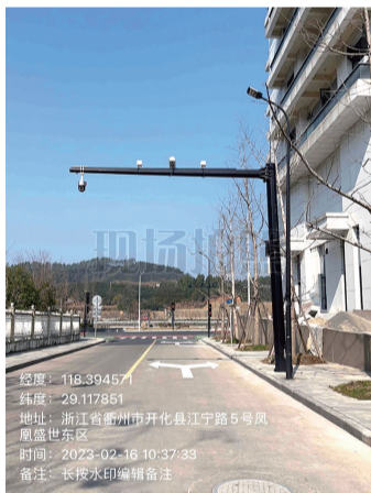
12. 江宁路路口违停抓拍