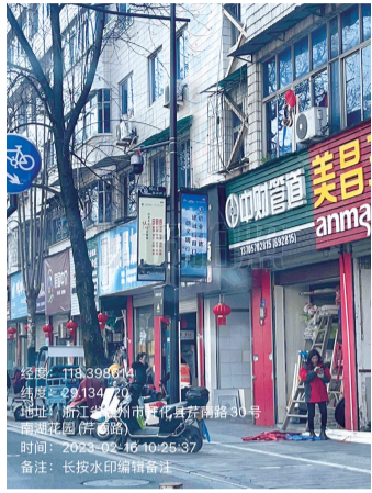
1. 芹南路超前水电门口违停抓拍

为进一步强化开化县主城区市容秩序监督管理,提高城市管理综合质量和效率,扎实推进文明城市创建工作,开化县综合行政执法局将于2023年3月13日启用智能违停抓拍设备,实时抓拍机动车未按规定停放的交通违法行为,并由开化县综合行政执法局和开化县交警大队根据《中华人民共和国道路交通安全法》及交通安全法律法规依法予以处理。现将智能违停抓拍设备具体点位公告如下: