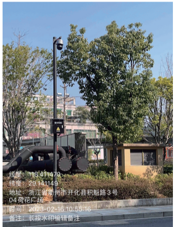
14. 积魁路路口违停抓拍