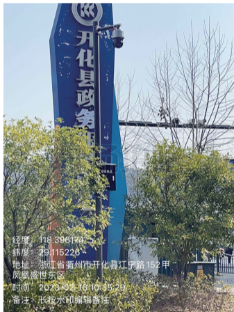
13. 政务服务中心门口违停抓拍