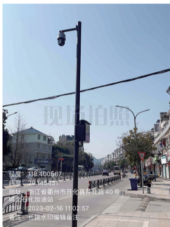
6. 城北加油站路段违停抓拍