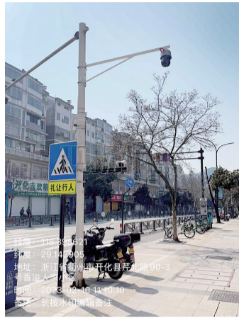
3. 芹北路林场对面违停抓拍