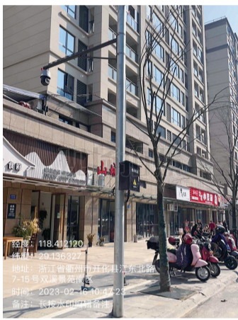
5. 凤凰天成北门对面违停抓拍