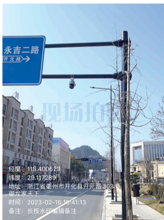
7. 吞滩村委会门口违停抓拍