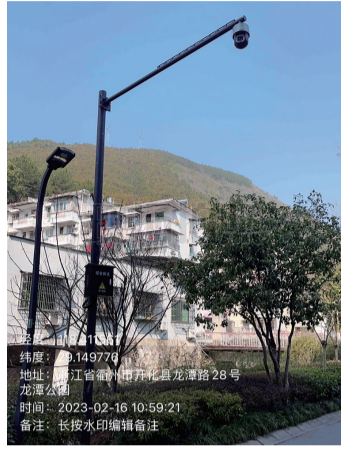
4. 龙潭路11号门口违停抓拍