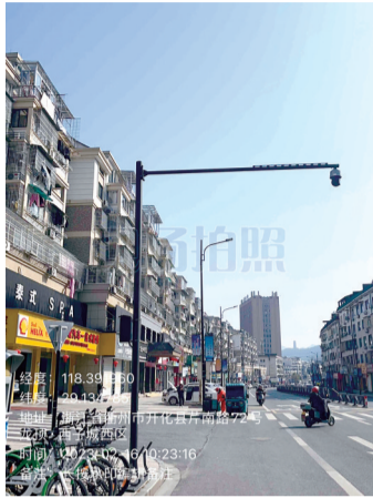
2. 芹南路72号中门口违停抓拍