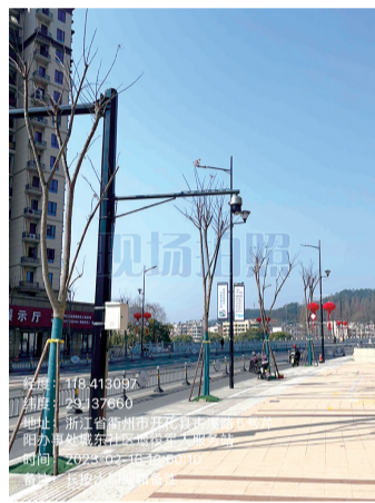
8. 古溪路双溪景苑违停抓拍