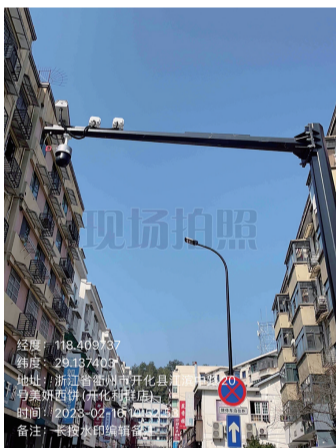
10. 月清路路口违停抓拍