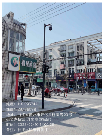
11. 桃林路路口违停抓拍