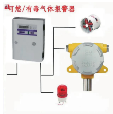
▲燃气报警器示意图

使用天然气的用户请联系天然气公司安装报警器并加装切断阀,使用瓶装燃气的用户按照要求自行采购。各经营单位要立即开展自查自纠,互相监督,并积极配合行业主管部门和燃气企业工作人员的宣传和安检工作。