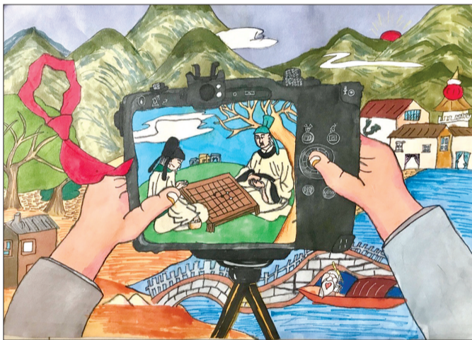
对弈 开化县北门小学 叶泽懿