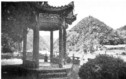
邱老金牺牲地遗迹