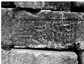
带有字印的城砖

此次大规模修葺城墙,其中开邑知县南廷瑛负责分修外城一百六十八丈七尺,内城九十四丈九尺,金钱、钟秀、北门月城建楼三座,上城马道四座,加高内外城身通济门下首各一百一十二丈,西北山上踏步一百六十丈,