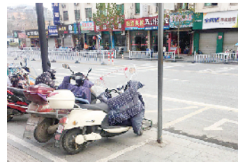
规范停放的非机动车,也能成为一道美丽的风景。