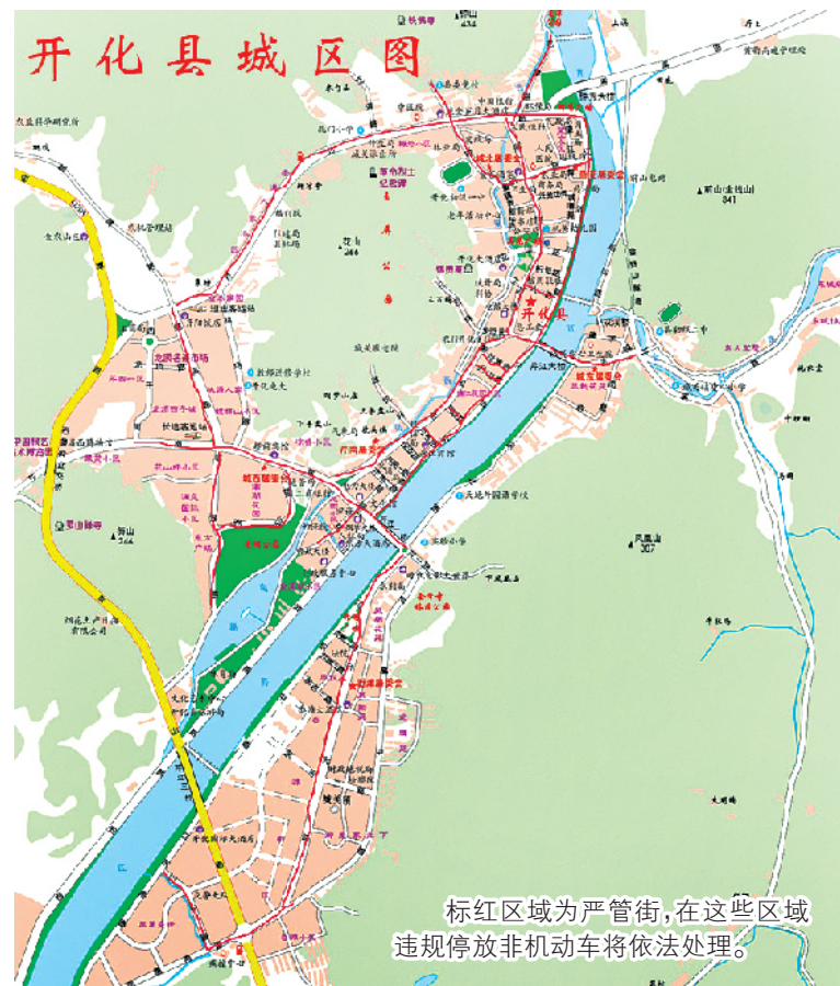
标红区域为严管街,在这些区域违规停放非机动车将依法处理。