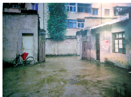
花山脚下,原举重训练房