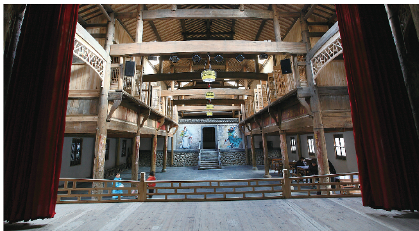
丰盈坦宗祠装饰一新