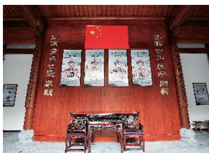
祠堂放着各姓宗族

仁宗坑村村民自元末明初迁居于此,已有600多年历史,自古以来各个姓氏就和睦相处,团结互助。在今后的发展上,村里将重点谋划乡村旅游项目,依托钱江源源头水资源,建设漂流项目,今年8月份试运行,届时将给全镇旅游带来新的亮点。 记者 余问清